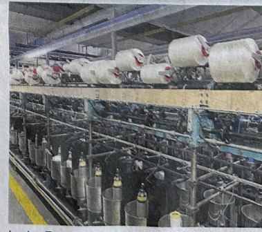
In der Zwirnerlei Untereggingen wurden Garne verarbeitet.