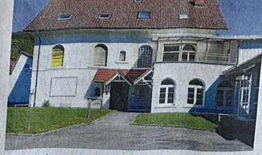
Momentan ungenutzt ist das Verwaltungsgebäude der ehemaligen Zwirnerlei Untereggingen.

konnte aber die Verluste auch nicht kompensieren. Die Vorschrift zur Verwendung von medizinischen Masken brachte dann auch diesen Markt komplett zum Erliegen. Zuletzt hatten auch stark gestiegene Stromkosten dazu geführt, dass die Zwirnerlei schließen musste. „Jeder Euro Umsatz enthält aktuell 25 Cent Strom“, ließ damals die ZUE in einer Pressemitteilung verlauten. Auch der Preisdruck durch die Produktion von Garnen in Billiglohnländern stieg stetig.